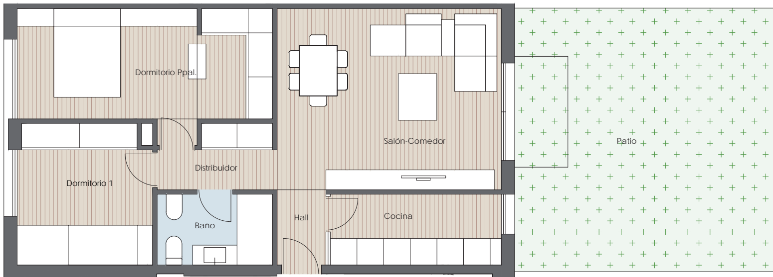
VIVIENDA BAJO T-01

TOTAL CONSTE. VIVIENDA CON ZZCC 82.13 m 2