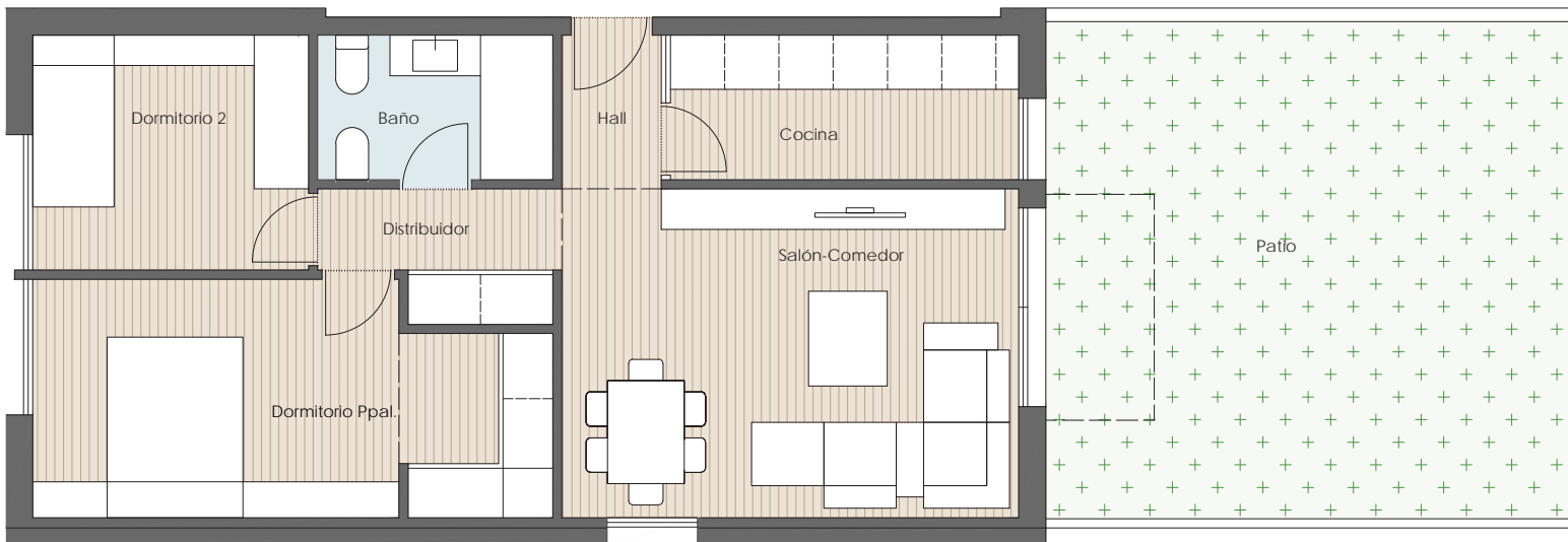
VIVIENDA T-02 ESQUINA